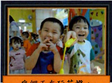
我們正在玩花燈， 真的很開心。