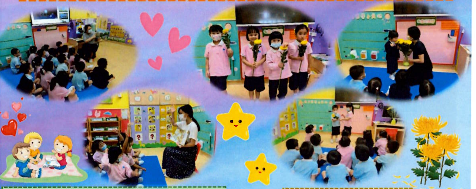
老師給我們說重陽節故事，我們很專心地聆聽。

本校於10月20日進行了重陽節節日活動，透過繪本欣賞、觀看教育影片，認識重陽節的由來及意義和食品，讓幼兒認識重陽節的傳統習俗。