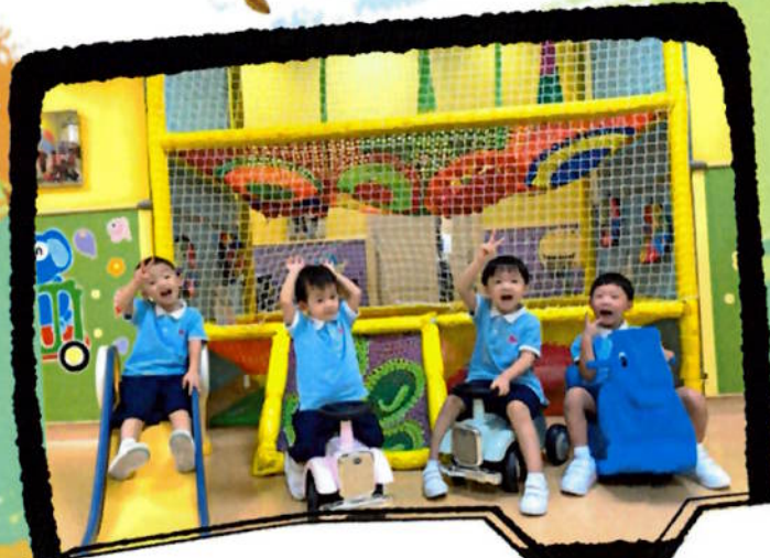
— 左至右 — 黃榮輝 張宇駿 李綸軒 陳俊銓