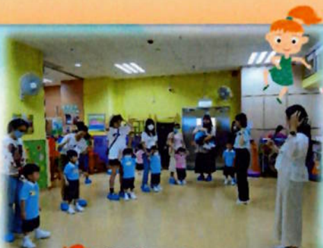
老師邀請幼兒在進行自我介紹。