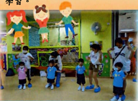
家長與幼兒正在參加親子遊戲。

本園於9月4日舉行親子初幼班迎新活動和新生適應活動，讓家長和幼兒認識學校的校長、主任、老師、同學、課堂活動模式和學校環境，有助新生適應，亦透過新生家長活動，讓家長了解幼在校的生活流程和學習。