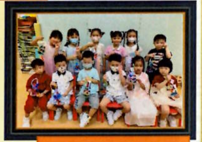
這是我們的圖工花 燈，很漂亮。