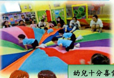
幼兒十分喜愛色彩繽紛的彩虹傘。